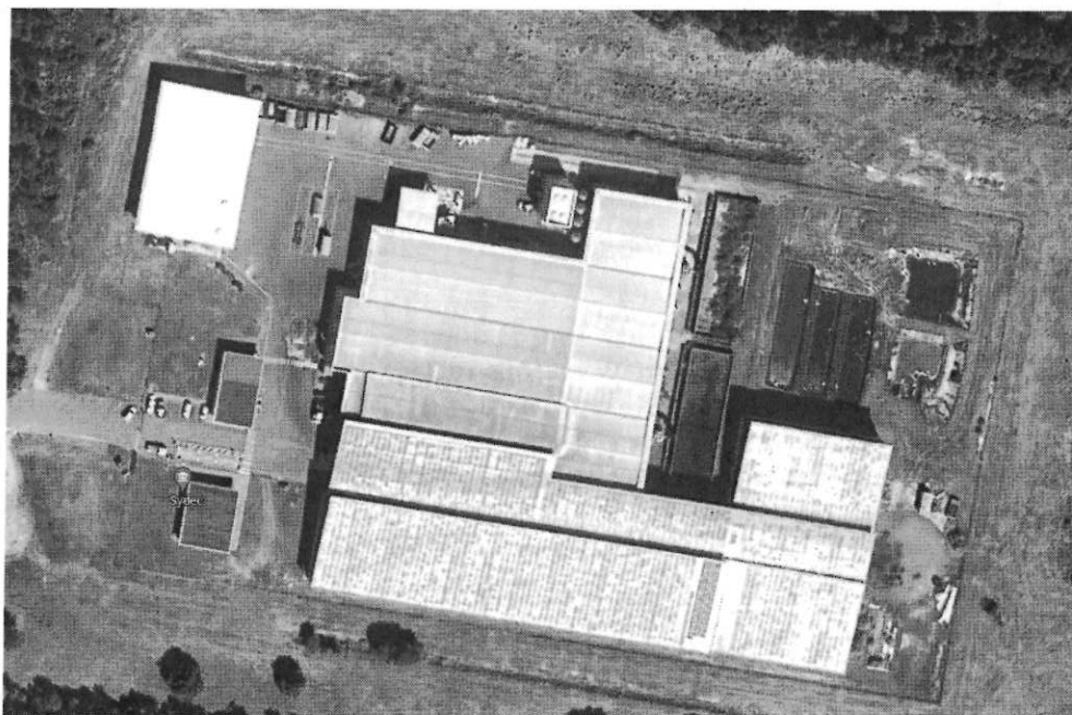
Vue aérienne du site

L'établissement, comprenant l'ensemble des installations classées et connexes, est organisé de la façon suivante :